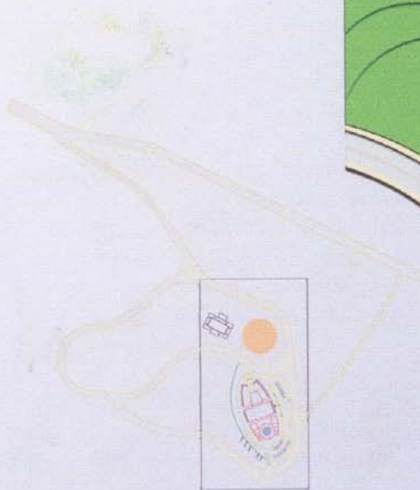
مخطط ربط طريقي 1/2000